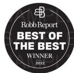
Le Meilleur Choix des Voyageurs 2022