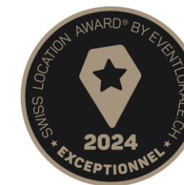
Label qualité "Exceptionnel" Swiss Location Awards