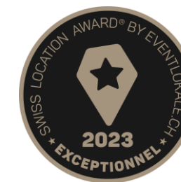
Label qualité "Exceptionnel" Swiss Location Awards