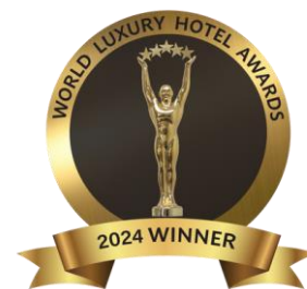
Hôtel Design de Luxe – Europe Occidentale Hôtel Boutique de Luxe – Suisse Hôtel Ecologique de Luxe – Suisse