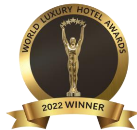
Hôtel Design de Luxe - Europe