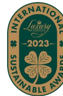
International Sustainable Award