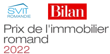
Coup de Cœur du Jury