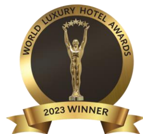
Hôtel Ecologique de Luxe – Europe Hôtel Design de Luxe– Suisse Hôtel Lifestyle de Luxe – Suisse